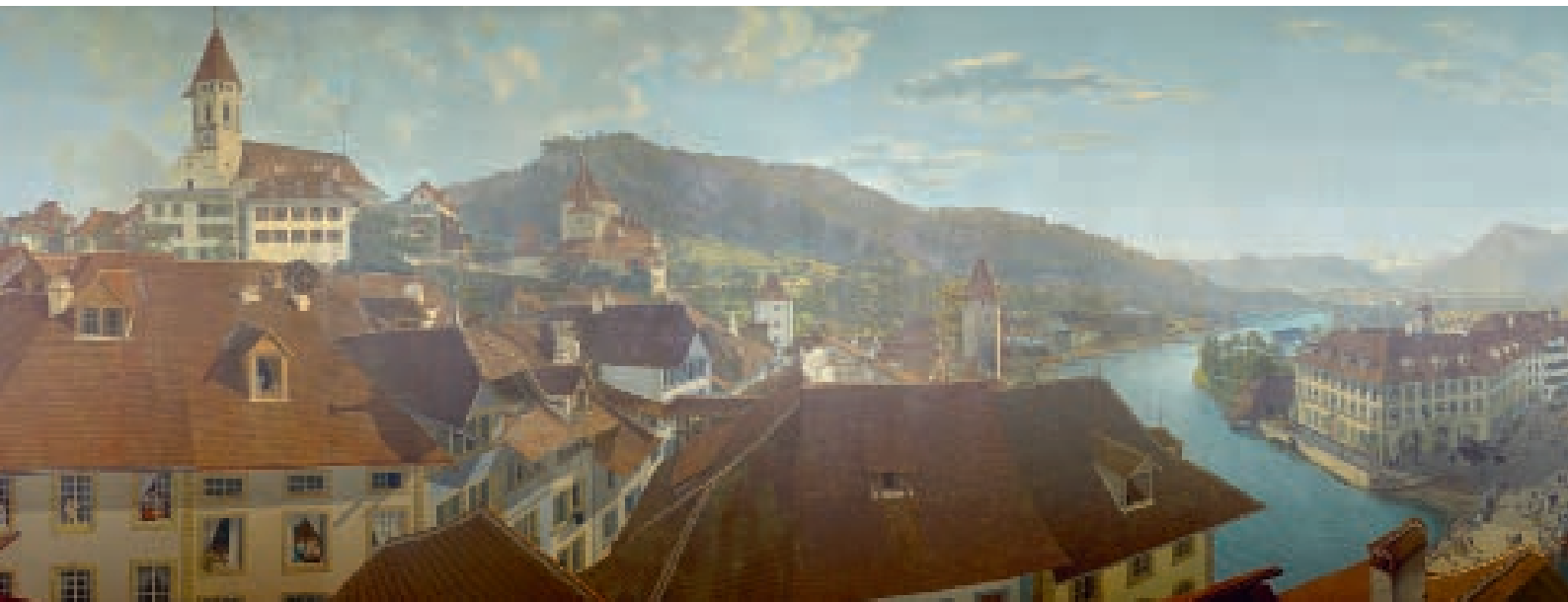
Thun Panorama von 1814